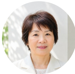
公益社団法人 スコーレ家庭教育振興協会講師

1959年、福岡県で生まれ、5歳から愛知県で育つ。 85年に結婚し、長男・長女・次男の母となる。 94年、「スコーレ協会」に入会。3人の子どもは中学生 のときに非行や不登校となるが、心の栄養不足による親 へのメッセージと受けとめ、子どものあるがままと認め る共感の子育てによって克服する。現在は3人とも社会 人として、たくましく成長している。 2016年、日本家庭教育学会第31回大会で、研究論文 「家庭は心の癒しの場」を発表。同学会認定の家庭教師。 やさしい笑顔と誠実さが、好感を抱かれている。