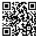
申込み QR コード

■次回セミナー 2/25 (水)「子どもの心に自信を育てる」 (スコーレHPから申込みください)