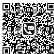
問合せ先 QR コード

データでご覧の場合、 申込み/問合せ先 QRコードをクリック又は タップしてもページに 移動します。