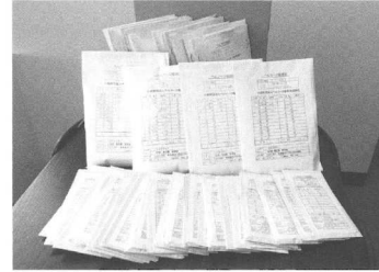
12月に送付したベルマーク

し、200万点の大体まであと一歩です。ご協力くださった皆様、改めて厚く御礼申し上げます。スコーレ協会・ボランティアセンターは、これからも真摯に収集ボランティアに取り組んでまいります。