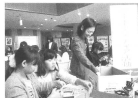
速星小学校の皆さん

当日は、社会福祉協議会の2名のスタッフと協力し、速星小学校・ボランティア委員の児童10名、先生3名が参加しました。今回は施設内での作業だったためか、通りがかりの親子連れなどの飛び込み参加もあり、例年より多くの方が収集品の整理を体験されました。